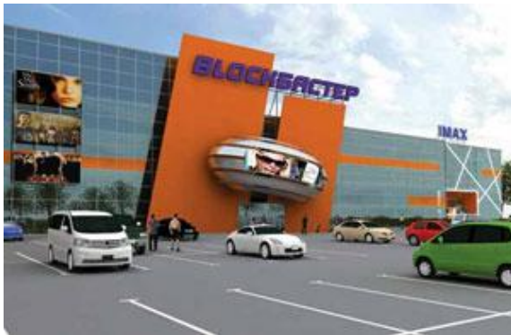
Мультиплекс Блокбастер, Киев (проект многозального кинотеатра)