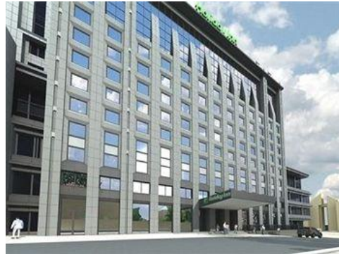
Отель Holiday Inn, Киев (проект «Защита от шума»)