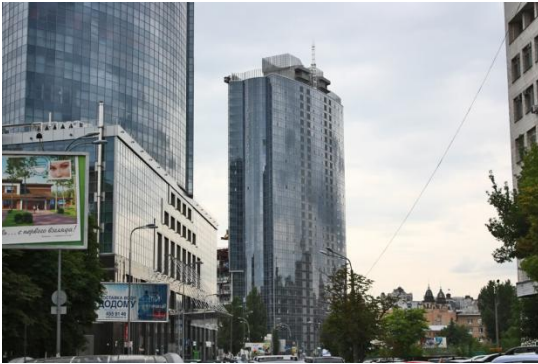
Бизнес-центр «Gulliver», Киев (комплексный проект «Защита от шума»)