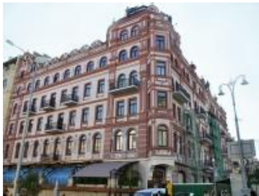
Офисный центр «Укравто», Киев (звукоизоляция инженерного оборудования)