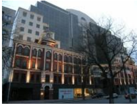
Бизнес-центр «Евразия», Киев (комплексный проект «Защита от шума»)