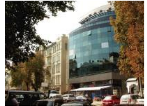
Бизнес-центр «Миллениум», Киев (комплексный проект «Защита от шума»)