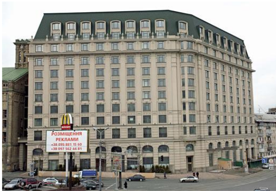
Отель Fairmont Grand Hotel, Киев (проект «Защита от шума»)