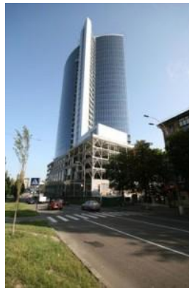
Бизнес-центр «Парус», Киев (комплексный проект «Защита от шума»)