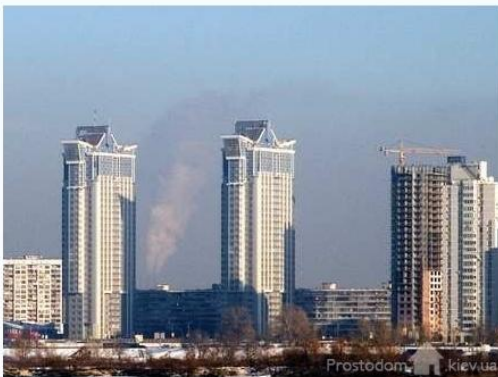
Жилой комплекс Серебряный Бриз, Киев (комплексный проект «Защита от шума»)