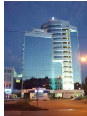
Офисный центр «Киевстар» (комплексный проект «Защита от шума»)