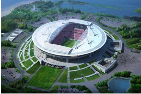
Стадион «Львов-Арена», Львов (виброизоляция инженерного оборудования)