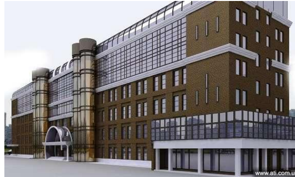
Бизнес-центр Риальто, Киев (звукоизоляция инженерного оборудования)