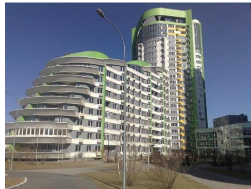
Жилой комплекс «Паркове Місто», Киев (проект «Защита от шума»)