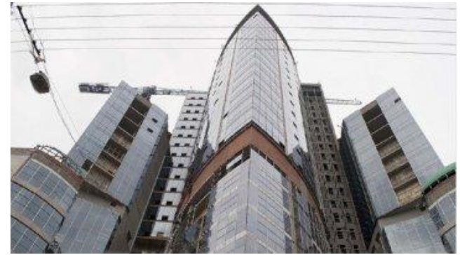
Отель Hilton, Киев (проект «Защита от шума»)