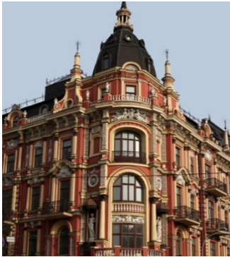
Отель Marriott Renaissance, Киев (проект «Защита от шума»)