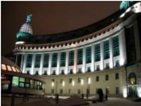
Банк Аркада, Киев (виброизоляция инженерного оборудования)