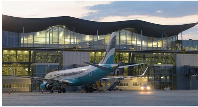
Аэропорт Борисполь, Терминал D, Киев (комплекс акустических исследований)