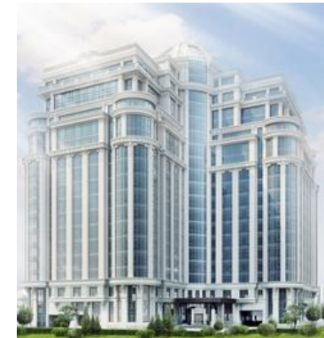
Жилой комплекс «Diamond Hill», Киев (комплексный проект «Защита от шума»)