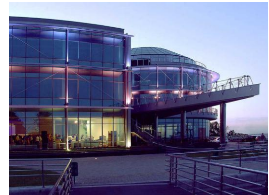
Клуб Кристалл Холл, Киев (проект «Защита от шума»)