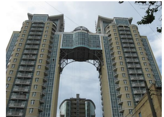
Жилой комплекс «Триумф», Киев (комплексный проект «Защита от шума»)