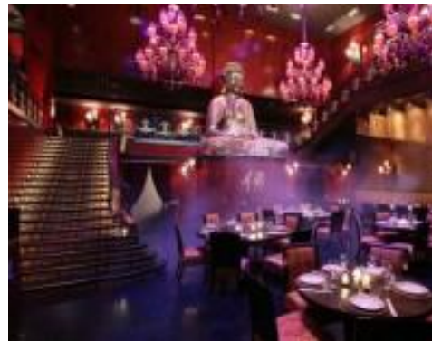
Клуб Будда Бар, Киев (акустика помещений)