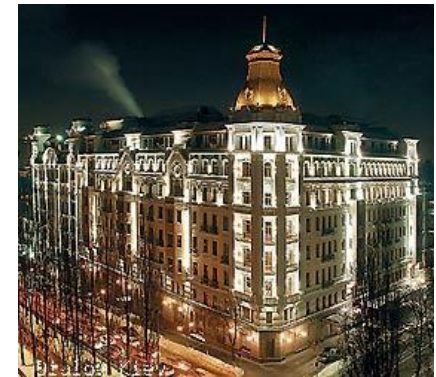
Отель Премьер Палас, Киев (звукоизоляция инженерного оборудования)