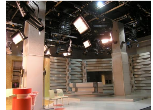
Телекомпания «Новый Канал», Киев (проект студийного комплекса)