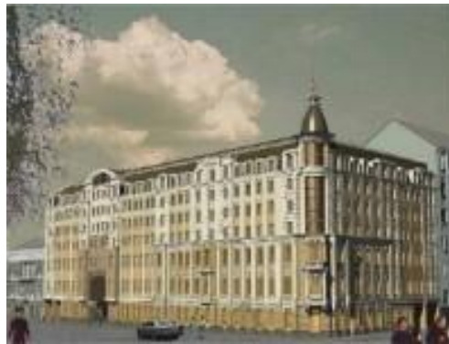
Отель Редиссон САС, Киев (звукоизоляция инженерного оборудования)